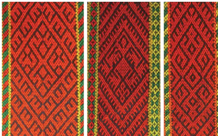
Рис. 1. Узор лягушки в лицзинь (автор: Ван И, 2022). Цифровая фотография. Источник: [12, рис. 2–56]. Копирайт 2022, China Textile & Apparel Press. Воспроизводится в научных целях в объеме цитирования

С оттачиванием мастерства и возвышением эстетического сознания узор лягуш-